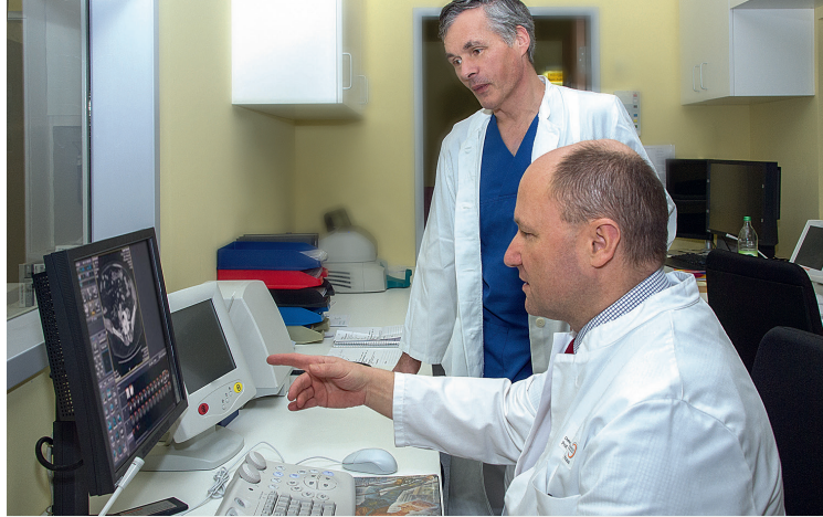
Bei uns steht der Mensch im Zentrum.

Die Medizinische Klinik II ist integraler Bestandteil des Darmzentrums Inn-Salzach, der interdisziplinäre Ansatz wird durch die Teilnahme am regelmäßigen Tumorboard und der guten Zusammenarbeit mit Haus- und Fachärzten der Region gelebt.