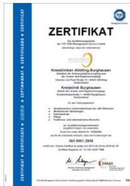
TÜV-Zertifikat der Kreiskliniken

Das Qualitätsmanagement der Kreiskliniken Altötting-Burghausen ist ein Instrument, das in erster Linie dem Patienten zu Gute kommt. Wir befragen Patienten, Angehörige und Arztpraxen regelmäßig nach ihren Erfahrungen in den Kreiskliniken um herauszufinden, was positiv beurteilt wird und was wir verbessern können.